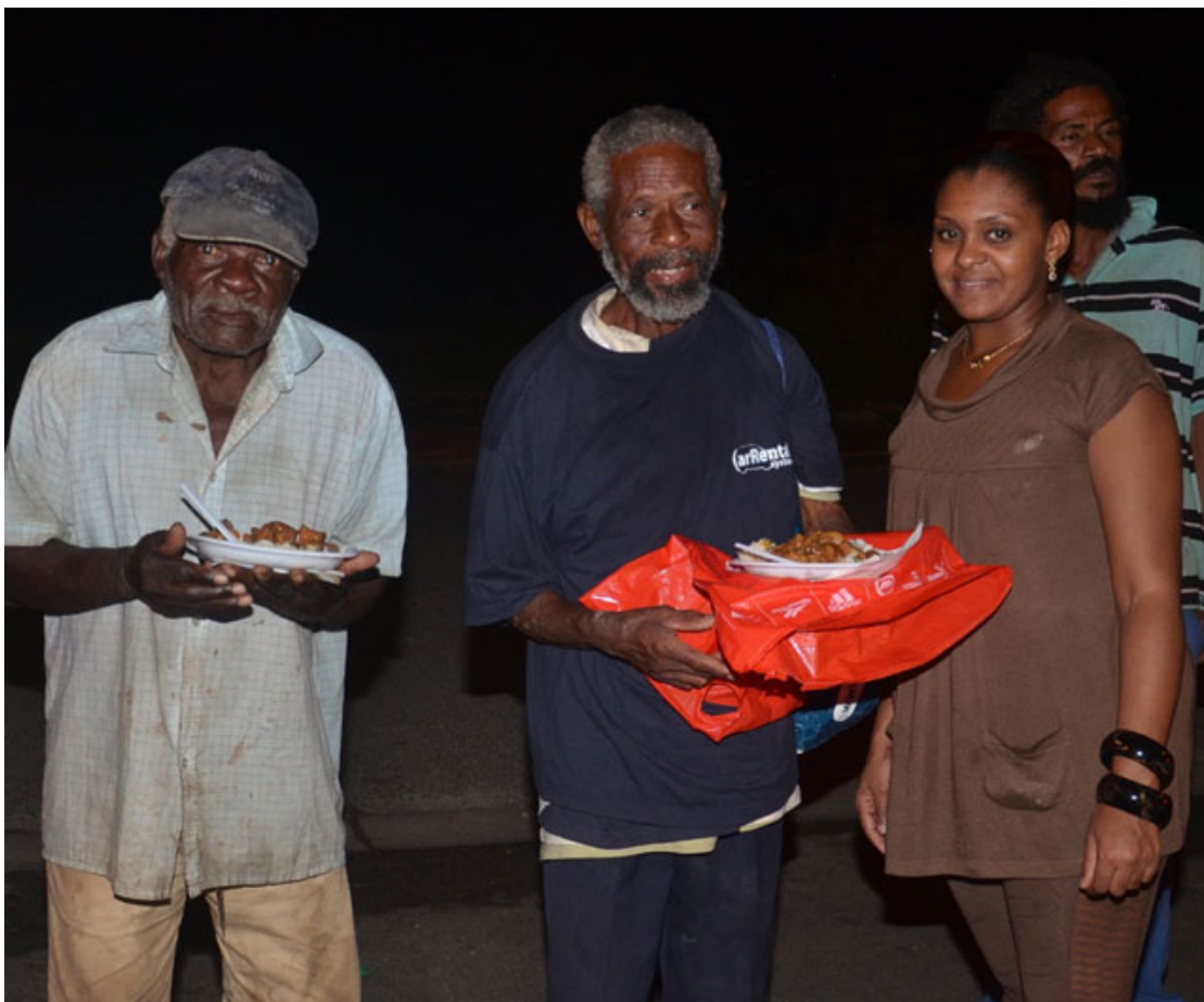
Sur le marché à « Man Réyo », le repas a été très apprécié -