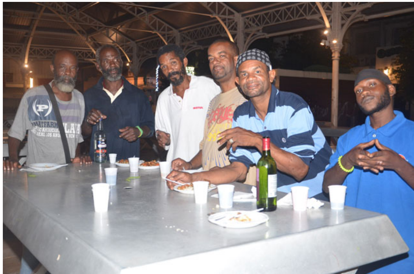
Il y avait comme un air de fête sur le marché aux épices à Pointe-à-Pitre

Jeremiah CARLTON | franceantilles.fr | 02.01.2013